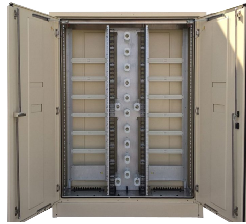
GRL010085A (FTTH G2 SP 2x40U P500)

L'armoire en aluminium de conception simple peau possède des portes, un toit, des plinthes et des panneaux démontables depuis l'intérieur , qui sont facilement remplaçables.