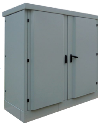
GRL008660A (FTTH DP 2x28U P850) GRL009519A (FTTH DP 2x40U P850)