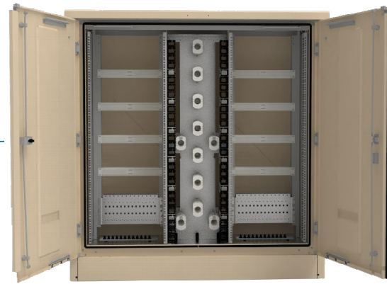
GRL010459A (FTTH G2 SP 2x28U P500)

L'armoire en aluminium de conception simple peau possède des portes, un toit, des plinthes et des panneaux démontables depuis l'intérieur , qui sont facilement remplaçables.