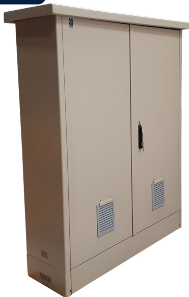
GRL010382A (FTTH G2 IS 2x40U P500)

GROLLEAU propose une armoire de rue SRO isolée 2x40U profondeur 500 mm pour équipements actifs.